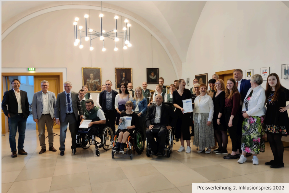
Preisverleihung 2. Inklusionspreis 2022